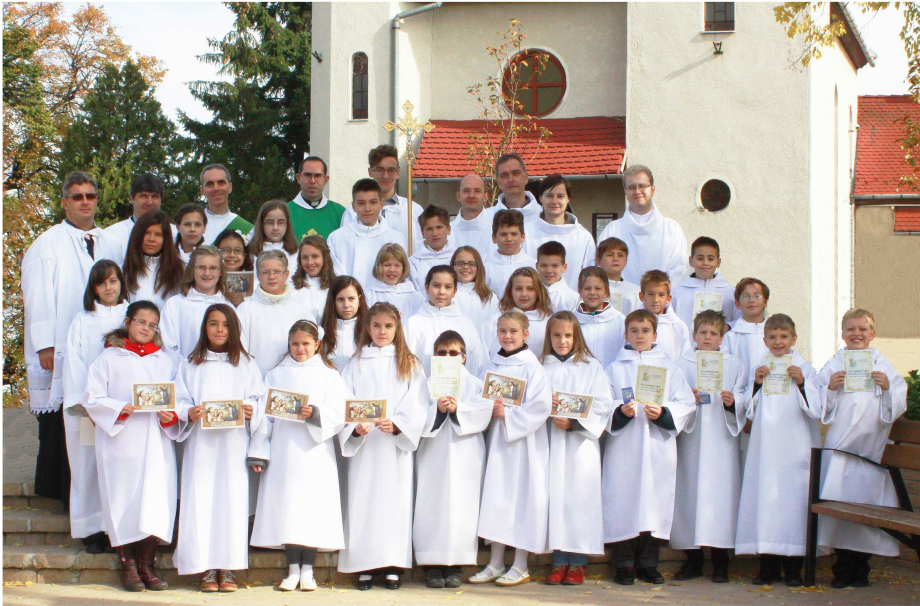
Első szentáldozásunk emlékére 2013. október 6. Jézus-Szive templom, Erdőkertes

Október 6-án Erdőkertesen 32 veresegyházi és erdőkertesi gyermek járult először szentáldozáshoz. Imádkozzunk értük, hogy hitük erősödését hozza az Oltáriszentséggel való rendszeres találkozás.